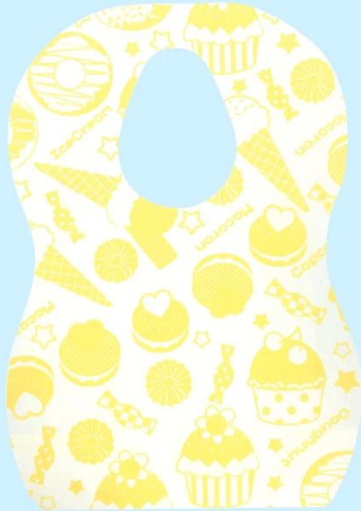
Forma a U opzionale e Pattern diverso supportato